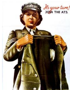
לבשי בגדי תפארתך

גלית: לא מזמן כתבתי מאמר על הדימויים של הנשים בכרזות הגיוס, שם הקריאה לנשים בהתחלה הייתה: בואי לעזור כי הבחורים לא יכולים בלעדייך ולאחר מכן הייתה קריאה לבוא לבשל עבור הגברים ורק בשלב השלישי הגיעה הקריאה "בואי לבשי בגדי תפארתך". בכרזה של האחים שמיר - בואי התגייסי לתפקיד קדמי ומשמעותי.